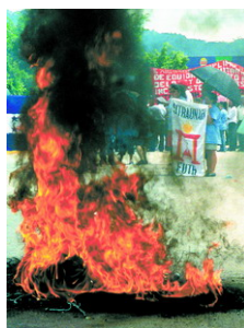
Manifestation du 11 octobre 2005 à l'UNAH

Le SITRAUNAH est une organisation créée pour lutter et défendre les intérêts économiques, juridiques et sociaux de ses membres. On cherche aussi à éduquer les membres sur les principes et l'idéologie du prolétariat mondial.