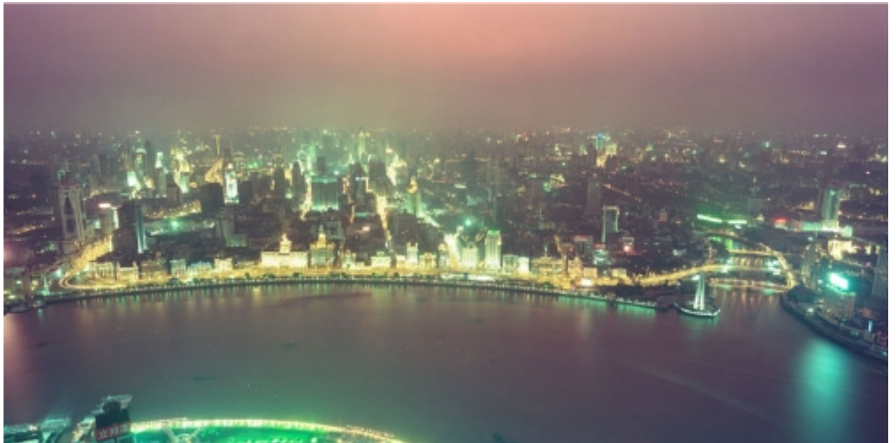
La nuit à Shanghai

Shanghai (Hu), est une ville dont la superficie de la région urbaine atteint 3925 km 2 . La population totalise 16 740 000 habitants. Elle se situe à l'avant du front du delta du Fleuve Yangtze, et elle correspond à la partie médiane de la ligne côtière du Nord-Sud de la Chine. La communication à Shanghai s'effectue aisément car elle est bien située et comporte un port important. Shanghai gouverne 16 divisions et 3 districts. Elle est une ville célèbre grâce à son histoire et à sa culture. Shanghai est aussi le berceau de l'industrie nationale de la Chine. Comme elle est la plus grande ville d'Extrême-Orient, Shanghai est connue comme la vitrine de commerce de la Chine. Elle a déjà établi des relations de commerce avec plus de 170 pays et régions différentes à travers monde. Shanghai s'est déjà positionnée comme l'un des centres internationaux de l'économie, des finances et du commerce du nouveau siècle !