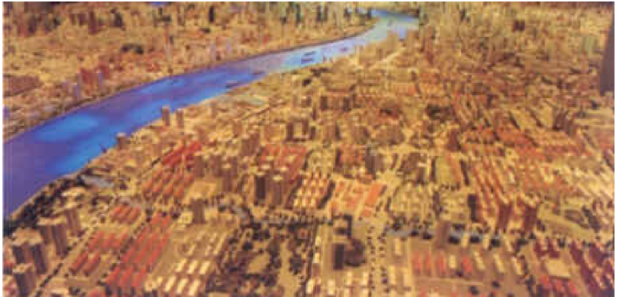
Vue aérienne sur Shanghai

En Chine, de nombreuses personnes, dont des économistes chinois, pensent que les syndicats sont inexistants, et qu'ils ne forment, en fait, qu'une simple organisation populaire fictive. Il y a lieu d'admettre que la majeure partie des syndicats chinois rencontrent des problèmes car ils sont fortement influencés par la situation politique particulière et hautement complexe qui prévaut dans le pays. Notons cependant qu'à Shanghai, une métropole qui connaît un boom économique des plus enviables, la fédération des syndicats de Shanghai constitue la voie d'expression par excellence de la classe ouvrière chinoise depuis les débuts de l'Histoire des syndicats chinois jusqu'à aujourd'hui. Aussi, cette fédération a influencé et enclenché des développements au niveau de l'ensemble des organisations des syndicats chinois.